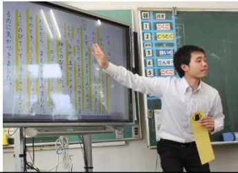
課題把握と個人思考