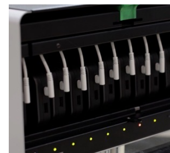
充電状態を示すLEDインジケーター