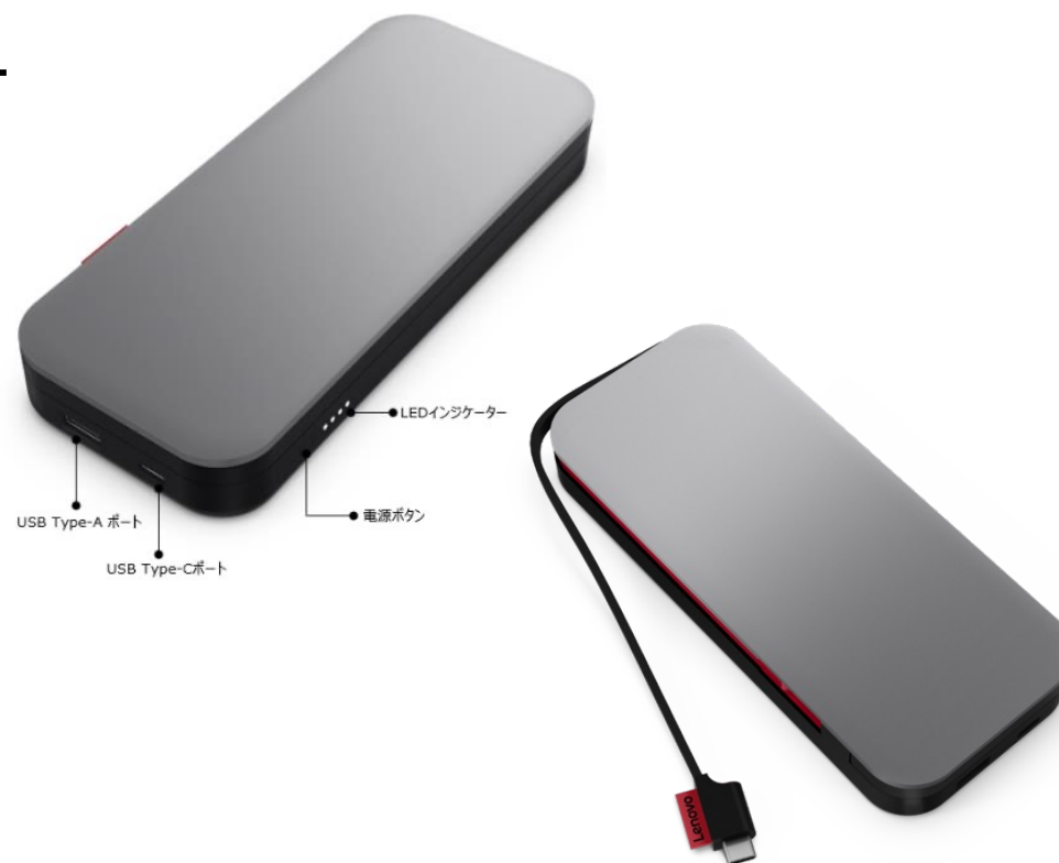
断線に強いType-Cケーブル標準装備

バッテリーへの過度な電圧による損傷と加熱を防ぐ設計を採用。 また、ショート防止機能も搭載。