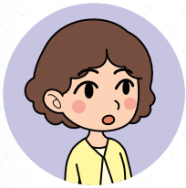
大規模小学校 学年主任

A スタンドアロン版はサーバー接続なしでご活用いただけます。 個人情報は端末のみに保存されます。