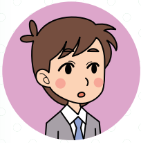
小学校教諭 大人数クラス担任

A まず学校環境をご確認ください。 ●校内サーバーがない。インターネットに接続できない。→スタンドアロン版 ●校内サーバーがある。→サーバー版 ●学校からインターネットに接続できる。→WEB版